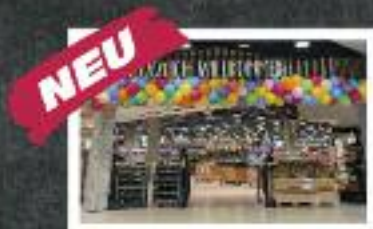
Meyer's Frischecenter Peiner Hag 1 25497 Prisdorf

Öffnungszeiten: Mo-Fr 8-20 Uhr / Sa 7:30-20 Uhr