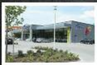
Meyer's Frischecenter Saarlandstraße 85 25421 Pinneberg

Öffnungszeiten: Mo-Fr 8-20 Uhr / Sa 7:30-20 Uhr