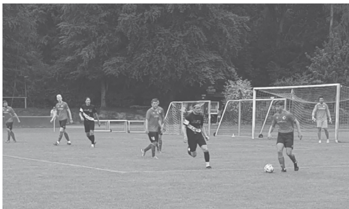
VfL Pinneberg - SV Lieth 3:2