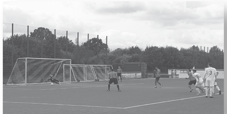
Tor Ramy Mansour Union Tornesch 2. - VfL Pinneberg