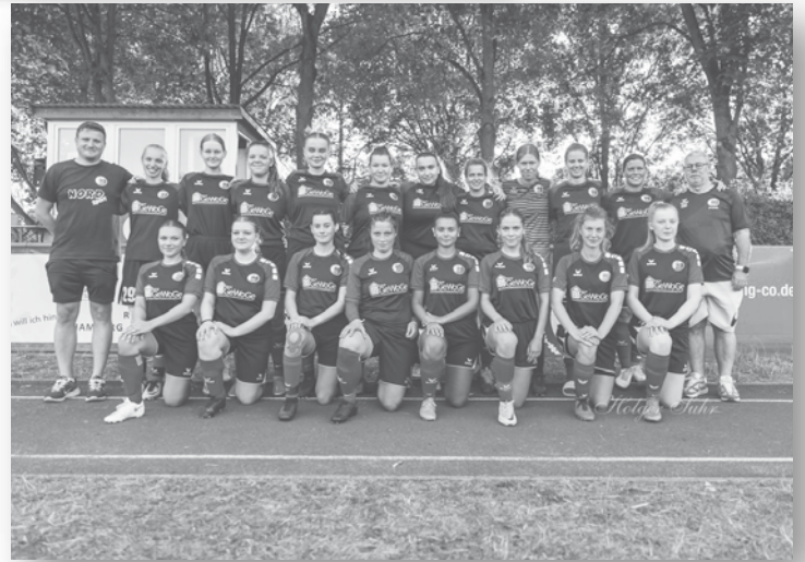
1. Frauen beim Löwinnen-Cup