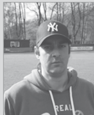
Ole Sellhorn Co-Trainer