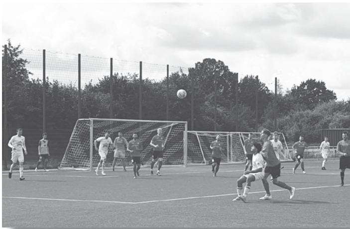
Union Tornesch 2. - VfL Pinneberg 2:1